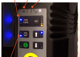
Taille de balle réglable

Sélecteur de matériaux : carton ou plastique Indicateur de balle complète Indicateur d'entretien