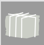
FIXATION TRANSVER- SALE

L'ORWAK COMPACT 3115 est indiquée pour des petits volumes de papier et plastique, mais elle est aussi conçue pour le compactage du carton. Un sélecteur de matériaux facilite la sélection des déchets ! La fixation transversale sécurise la balle, et cette fonction est particulièrement utile pour le compactage du plastique souple ou des petits morceaux de matériaux.