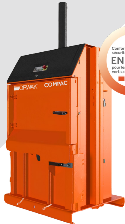
POIDS DE LA BALLE CARTON

Conforme à la norme de sécurité EN 16500 pour les presses à balles verticales ORWAK