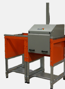
L'unité multi-chambres possède un tablier et deux poignées.