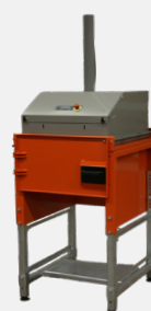
L'unité à chambre unique avec une porte pivotante.

Le compacteur est évolutif grâce à l'ajout possible des chambres supplémentaires. La porte avant de l'unité à chambre unique est alors remplacée par un tablier pour faciliter un mouvement aisé de la tête de compactage d'une chambre à l'autre.