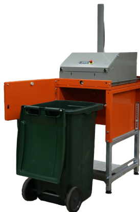
Conçu pour les poubelles standard de 240 litres.

Le modèle 4240 offre une utilisation simple ! La version multi-chambres est en fait un système pratique à chargement par le haut, tandis que la version à chambre unique nécessite seulement l'insertion de la poubelle. La sécurité et la qualité sont nos priorités et le compacteur fournit une sécurité individuelle optimale pour l'opérateur et les personnes à proximité. Un indicateur de position de poubelle garantit que le compacteur ne démarrera que si la poubelle est bien positionnée.