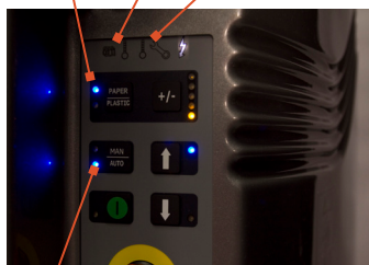
Taille de balle réglable

Sélecteur de matériaux : carton ou plastique Indicateur de balle complète Indicateur d'entretien