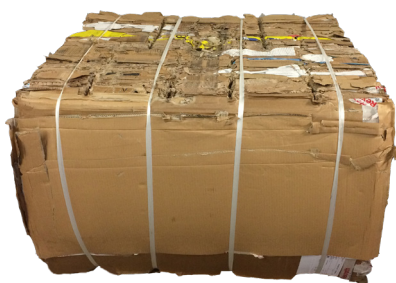
Balles de haute densité

Le système de verrouillage à 'loquet et manette' de la porte inférieure permet à l'opérateur d'ouvrir progressivement la porte de manière contrôlée, même lors du compactage de matériaux expansibles.