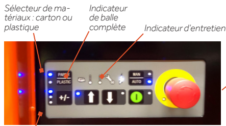
Taille de balle réglable

Les balles pèsent jusque 150 kg et sont facilement éjectées grâce à une fonction semi-automatique.