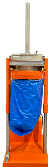
Hauteur de vidage de 2660 mm est standard

Le matériau est inséré facilement dans l'unité à chargement par le haut. Le compacteur est simple et sûr à utiliser, et la fonction de levage intégrée facilite et accélère le processus de changement de sac.