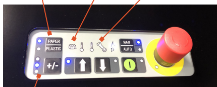
Taille de balle réglable